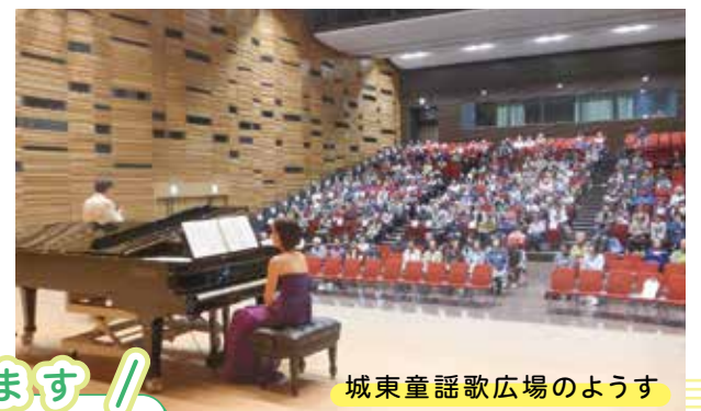
城東童謡歌広場のようす

現在は多くの方が参加される童謡や懐メロなどを歌う“城東童謡歌広場”をはじめ、歌手やピアニストを招いたイベント、地域で開催されている食事サービスでのハーモニカ演奏などと積極的に活動を行っています。