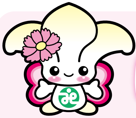
城東区社協マスコットキャラクター「じょーたん」