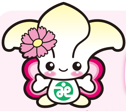
城東区社協マスコットキャラクター「じょーたん」