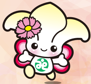
城東区社協 マスコットキャラクター「じょーたん」