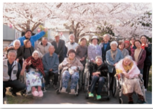
満開の桜を楽しむお花見

城東区在宅サービスセンター「ゆうゆう」は介護保険のサービスとして、要介護認定・要支援認定を受けておられる人に、通所により入浴・レクリエーション・食事などのサービスを提供し、外出することにより人との触れ合い、社会的孤独感の解消および、心身機能の維持を図ることを目的としています。また、介護されているご家族の身体的・精神的負担の軽減を図ることも目的の一つとしています。