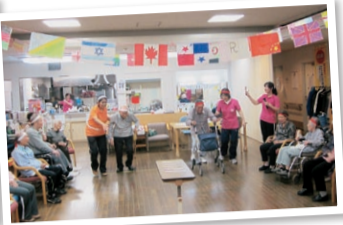
応援にも力が入る運動会