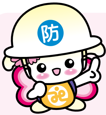
城東区社協マスコットキャラクター「じょーたん」